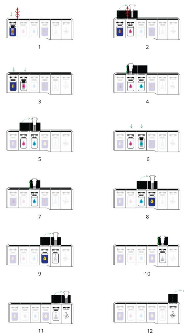
Abbildung 2. Schematische Darstellung der Färbeschritte der RAL StainBox