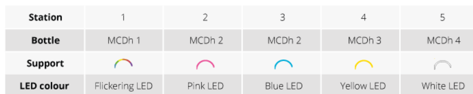
Tabelle 1. Flaschenhalterungen und -positionen