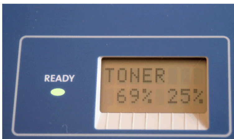
Rys. 1-3: Pozostała wydajność tonera podana dla tonera o całkowitej wydajności 6000 stron (po lewej) i 2500 stron (po prawej).

W dowolnej chwili istnieje możliwość sprawdzenia ilości pozostałego tonera i stanu zespołu bębna za pomocą menu eksploatacyjnego USAGE. Lewa wartość procentowa to pozostała wydajność tonera w przeliczeniu na zasobnik z tonerem o całkowitej wydajności 6000 stron.