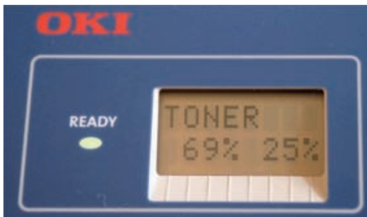
Fig.1-3: Capacidad de un cartucho de tóner para 6.000 y 2.500 páginas

El porcentaje restante de la capacidad del cartucho de tóner indica la capacidad restante para un cartucho de tóner de 6.000 páginas.