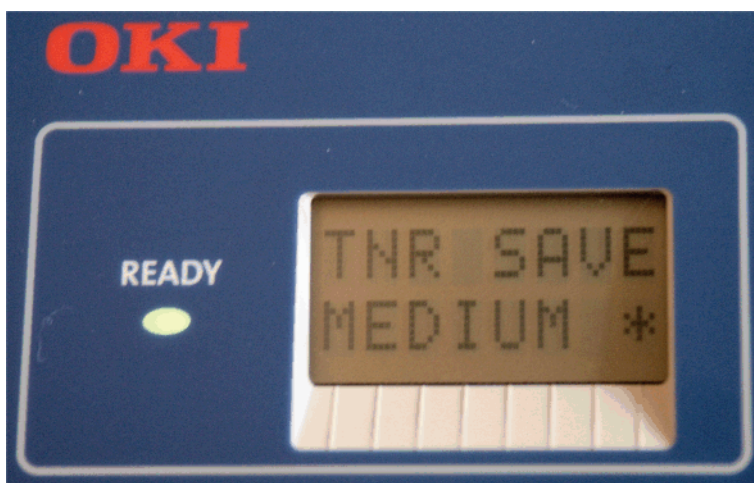
Fig.1-2: Menu di risparmio del toner