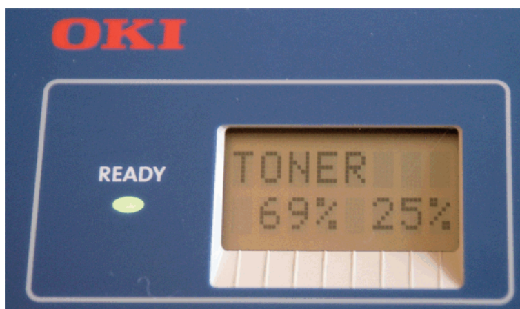
Abb.1-3: Füllmenge in Prozent von Tonerkartuschen für 6000 und 2500 Seiten

Die linke Prozentzahl gibt dabei die verbleibende Füllmenge für eine Tonerkartusche an, mit der 6000 Seiten gedruckt werden können.